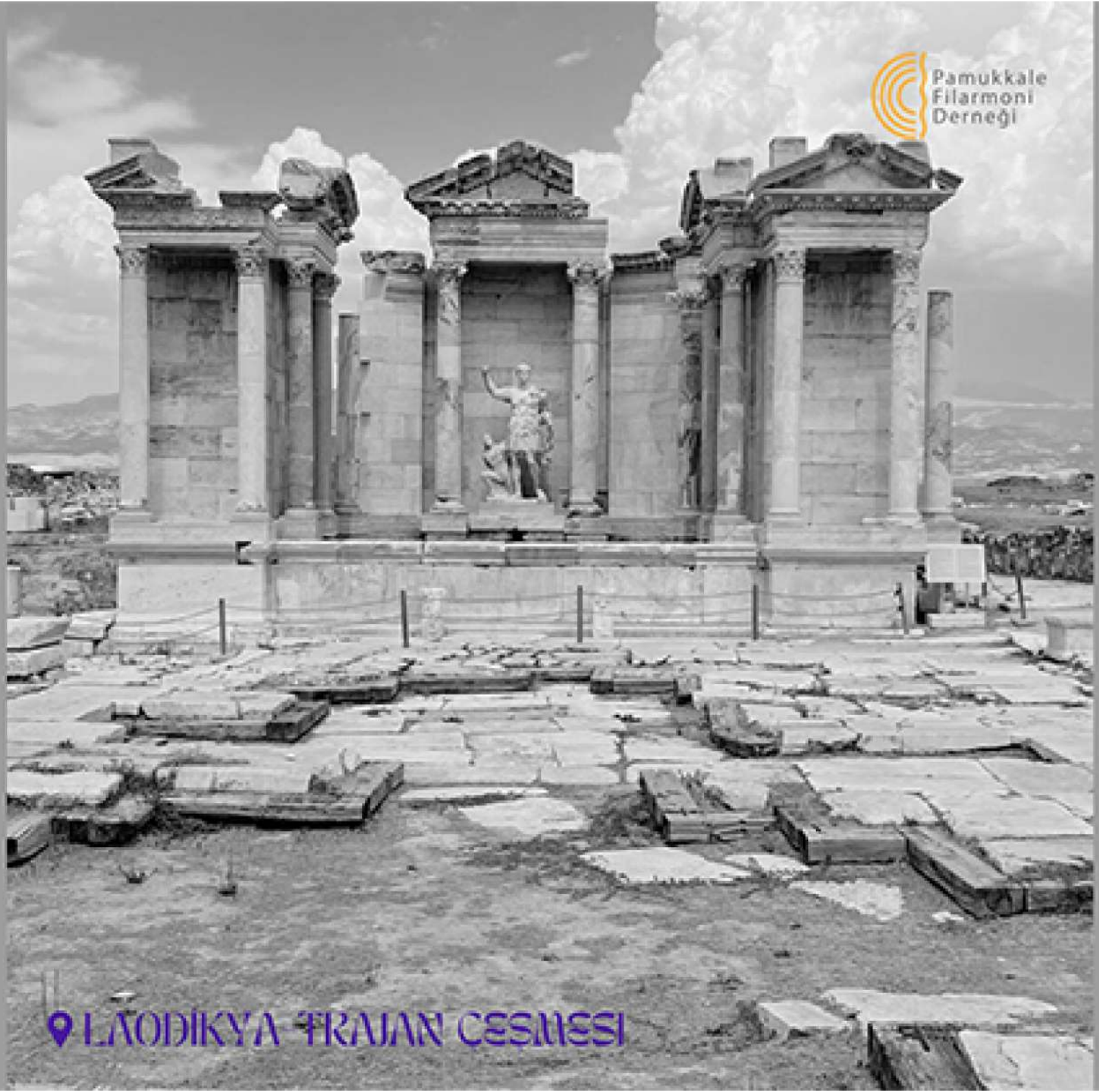
LAODIKYA TRAJAN ÇESMESİ